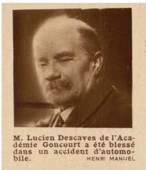
VU , 18 mai 1932.

vains, la représentation visuelle est la même : tantôt les instantanés captent le mouvement et créent un effet de dynamisme, tantôt les portraits photographiques maintiennent la visée édifiante du portrait pictural pour célébrer les vedettes de l'actualité. Passés à la moulinette des dispositifs des hebdomadaires de l'entre-deux-guerres, académiciens et lauréats sont starisés au même titre que les sportifs ou les acteurs. Le 18 mai 1932, VU évoque même dans un écho l'accident de voiture de Lucien Descaves, portrait photographique à l'appui : la vedette prend ici le pas sur l'écrivain, le fait divers sur la critique littéraire.