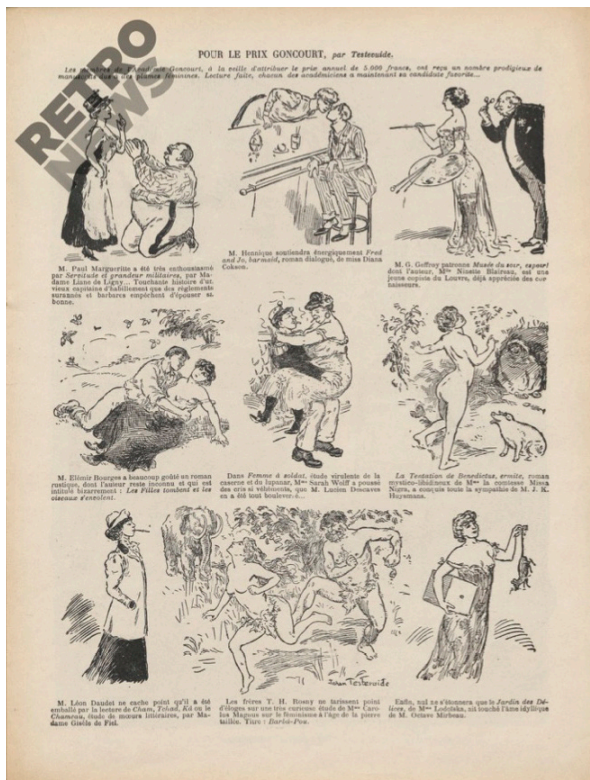
Le Rire, 10 novembre 1906

Dans Les Mystères de l'Académie Goncourt , Jean Ajalbert témoigne de ce qu'on pourrait appeler la médiaticité du Prix Goncourt, construite par les différents dispositifs que l'on vient d'identifier :