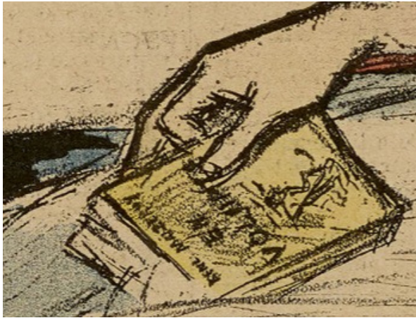
Figures 6 et 6 bis : Jean Grandeau, « Névrose », Gil Blas illustré , 14 août 1896.

« leurs poignantes misères », se tenant « en pleine donnée démocratique et sociale 47 ».