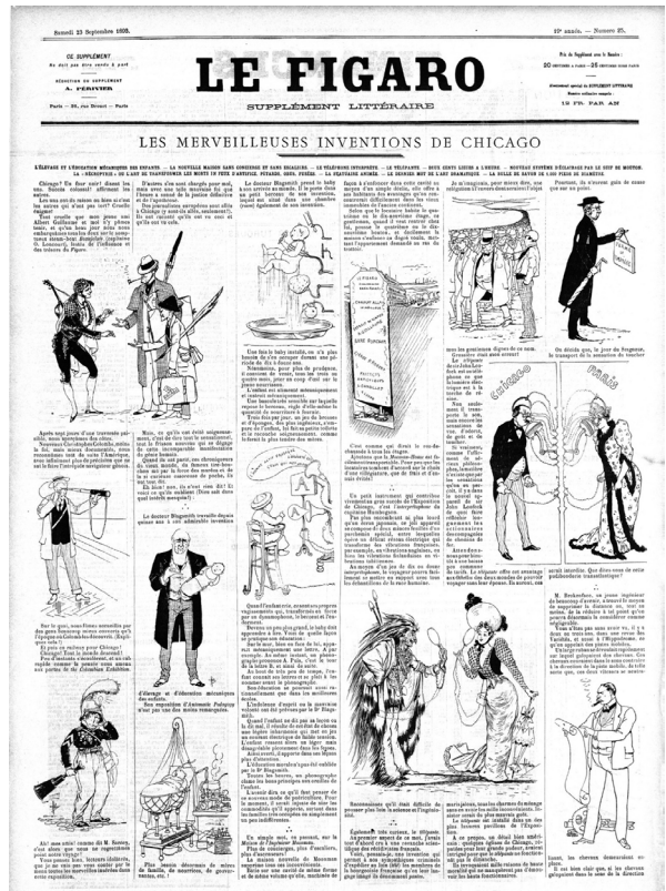
Figure 3 : Supplément littéraire du Figaro , 23 septembre 1893, p. 1.

Mais si le quotidien met en lumière l'écrivain au même titre que d'autres figures publiques, son supplément littéraire lancé à la même période traite presque exclusivement des personnalités du monde artistique. La visée éditoriale de ces suppléments vendus en fin de semaine, spécialisés dans le domaine culturel (de six à huit pages, ils disposent d'une large variété de publications artistiques), est à comprendre dans le cadre d'une « stratégie commerciale de complémentarité » avec le quotidien principal. C'est pourquoi notre étude se focalisera sur ces hebdomadaires illustrés, lancés par des journaux à l'identité mondaine et encore fortement influencés par la matrice littéraire décrite par Marie-Ève Thérenty 7 , dont on retrouve encore des traces à la fin du siècle. L'Écho de Paris , d'abord, publie la fameuse enquête de Huret évoquée plus haut ; le Gil Blas est spécialiste des échos mondains, comme le souligne Christian Delporte 8 , et publie par exemple une chronique des « villégiatures littéraires » suivant les déplacements des auteurs en dehors