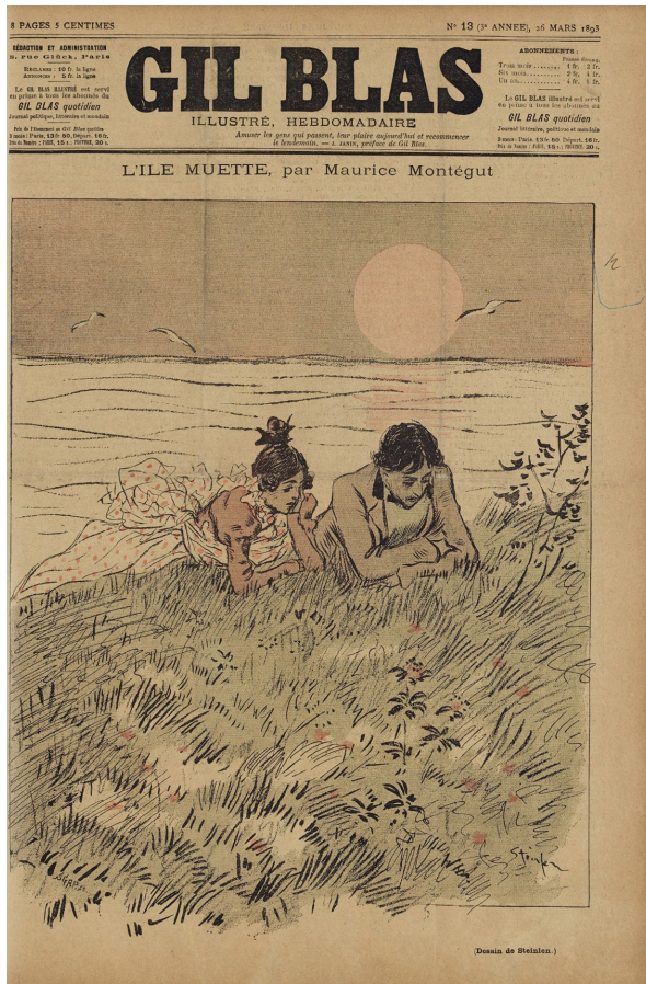
Figure 2 : Gil Blas illustré , 26 mars 1893, p. 1.

laisse place en conséquence à une parole banalisée sinon répétitive dans le quotidien de la Belle Époque. L'inscription en 3 e page de la rubrique des enquêtes et interviews d'écrivains, aux côtés des faits divers, de la bourse et des potins mondains, souligne cette désacralisation de l'auteur.