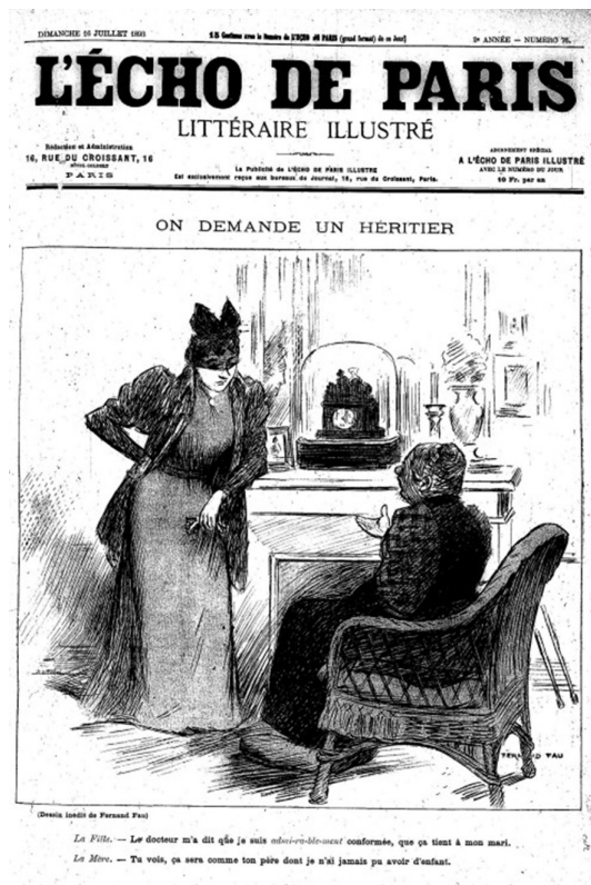
Figure 1 : Écho de Paris illustré , 16 juillet 1893, p. 1.